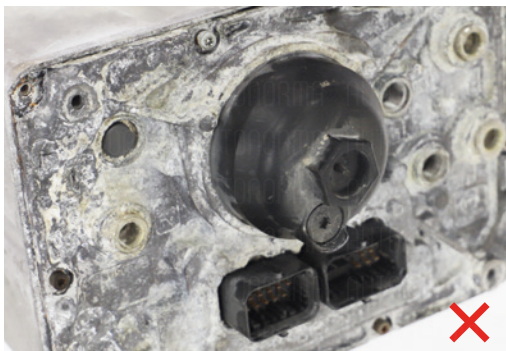
Díl poškozený močovinou ADblue