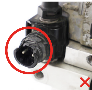
Poškozený konektor čidla tlaku